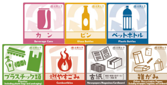
ゴミ分別ステッカー

また、下宿等住まいでのごみについても、お住まいの自治体の分別方法に従い分別に努めてください。なお、京都市では、新聞やダンボールの他にも「雑がみ(紙箱やメモ用紙、ふせん等)」の分別・リサイクルが条例により義務化されているため、分別によりリサイクルに努めましょう。