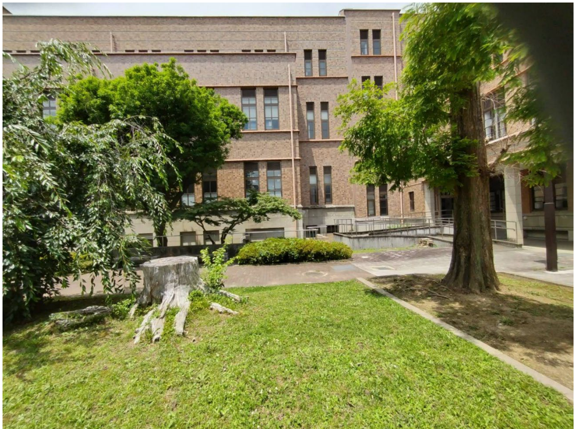
写真1(中央の茂みです)

付近にはベンチが多くあり、また一定の人通りもあります。被害が出る前に確認や対応をしていただけたら幸いです。