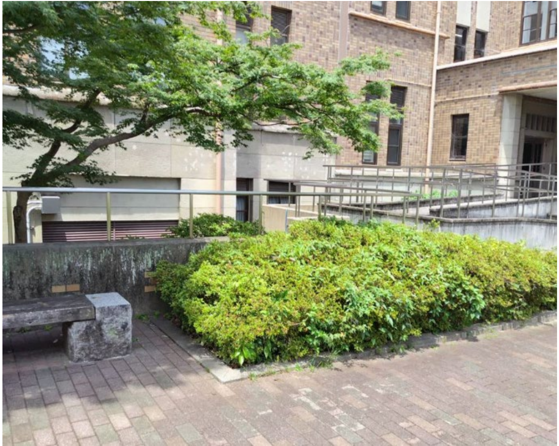
写真2(南側の側面中央から飛び出してくることが多いです)