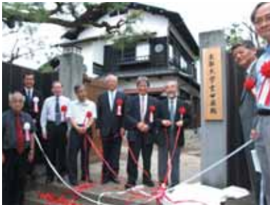
「吉田泉殿」オープニングセレモニー