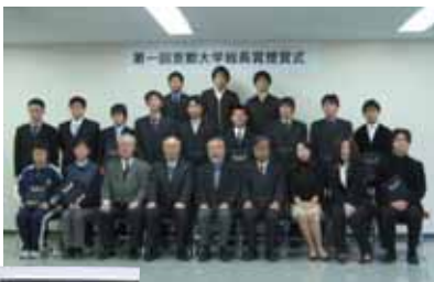
第1回京都大学総長賞授賞式