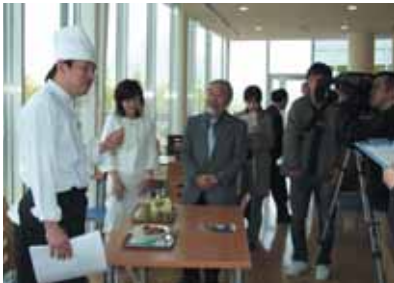
桂キャンパスでの総長カレー提供についての記者発表会