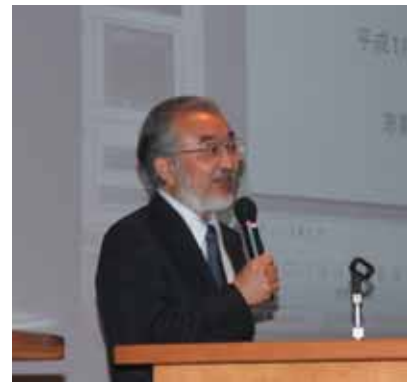
京都大学同窓会設立総会