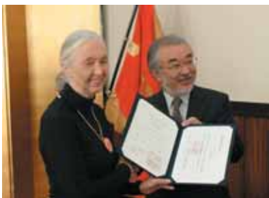
ジェーン・グドール名誉博士称号授与式