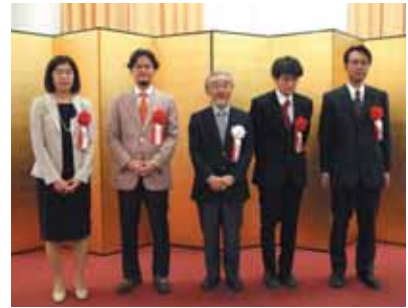
第1回湯川・朝永奨励賞授賞式