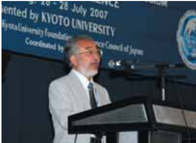
第10回京都大学国際シンポジウム