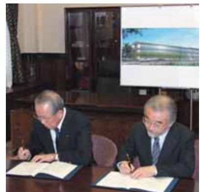
稲盛財団記念館調印式