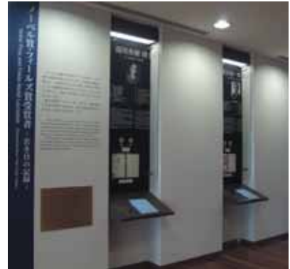
ノーベル賞・フィールズ賞受賞者展示コーナー