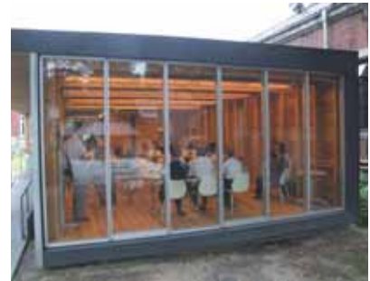
国際交流セミナーハウス