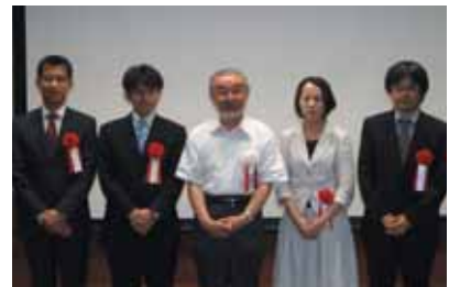
京都大学創立111周年記念論文コンクール授賞式