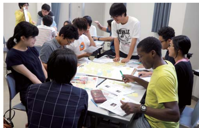
「ワイルド&ワイズ共学教育受入れプログラム」受入れの様子