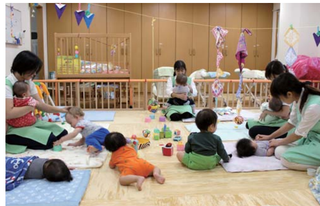
男女共同参画推進センター 保育園入園待機乳児保育室

WはWomen and the World。これまで政府は男女共同参画社会の実現を目指し、数々の対策を奨励してきました。京都大学も学生に占める女性の比率は2割を超え、事務職員・技術職員では6割近くになりましたが、教員はまだ1割近くに留まっています。この比率は徐々に上昇すると思いますが、まずは女性が働きやすく、勉学に打ち込める環境作りが必要です。出産・育児休暇が男女とも取りやすく、それが仕事や勉学を継続する妨げにならないような仕組みや、女性に優しい施設・システムづくりを考えていきます。男女共同参画を支える環境・支援体制整備に加え、休業から復帰後の子育て期に柔軟な働き方を選べる制度を構築するため、男女共同参画推進アクション・プランを作成し、その事業推進に努めます。また、京都大学という「窓」を通じて、学生が希望をもって社会に羽ばたくことができるよう、学生が自身の能力に自信を持てるような成長の機会を創出します。