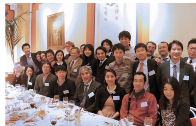
欧州洛友会(欧州同窓会)