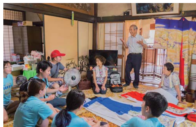
サマープログラム「China-Japan-Korea SERVE Initiative 2017」