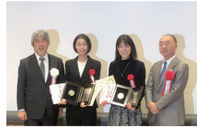
京都大学たちばな賞(優秀女性研究者賞)