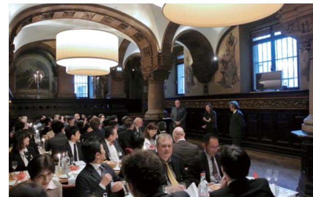
ハンブルク大学-京都大学共催シンポジウム2017 オープニングセレモニーの様子