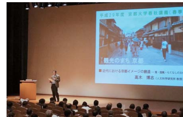
公開講座「春秋講義」