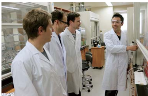
高等研究院における研究風景(実験室での研究ミーティング)