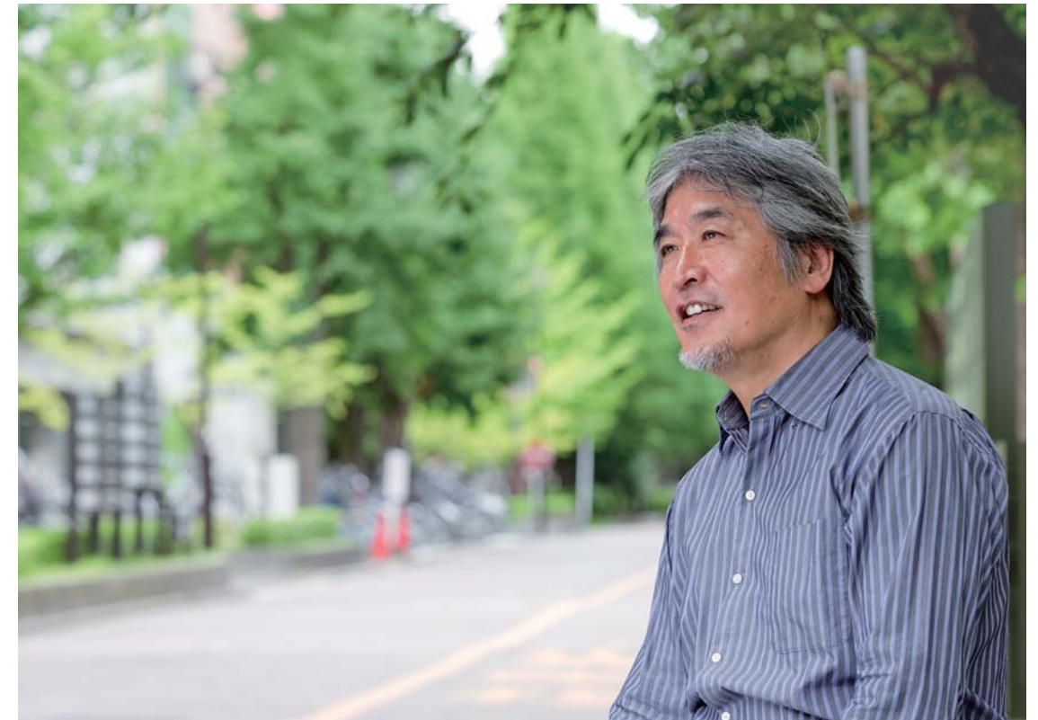
京都大学総長 山極 壽一

京都大学は創立以来、自由の学風のもと対話を根幹とした自主独立と創造の精神を涵養し、多元的な課題の解決に挑戦して、地球社会の調和ある共存に貢献すべく、質の高い高等教育と先端的学術研究を推進してきました。学問を志す人々を広く国内外から受け入れ、国際社会で活躍できる能力を養うとともに、多様な研究の発展と、その成果を世界共通の資産として社会に還元する責務は、ますます重要になりつつあります。