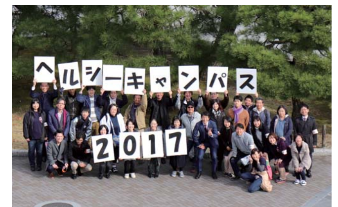
「京都大学ヘルシーキャンパス」キックオフフォーラム集合写真