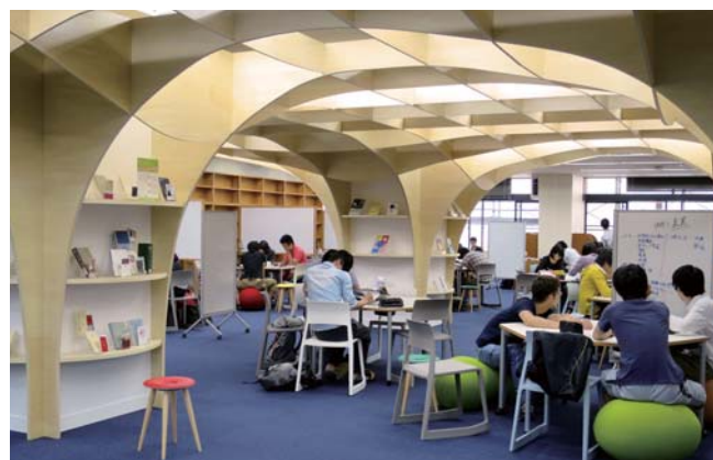
グループワークやディスカッション等が可能なスペース「ラーニング・コモンズ」(附属図書館)