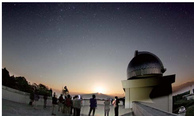
市民を対象とした「飛騨天文台 自然再発見ツアー」

DはDiverse and Dynamic。グローバル化時代の到来により、現代は多様な文化が入り混じって共存することが必要になりました。これまで強みを発揮してきた日本の均質性は、国際競争が激化する現代では時として創造力を弱め、イノベーションの育成を阻んでいると言われます。京都大学は多様な文化や考え方に対して常にオープンで、自由に学べる場でなければならぬと思います。一方、急速な時代の流れに左右されることなく、自分の存在をきちんと見つめ、悠久の歴史の中に自分を正しく位置づけて堂々と振る舞うことも重要です。京都大学はその躍動を保証する静謐な学問の場を提供したいと思っています。