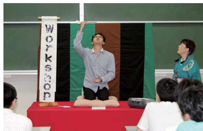
「ワイルド&ワイズ共学教育受入れプログラム」受入れの様子