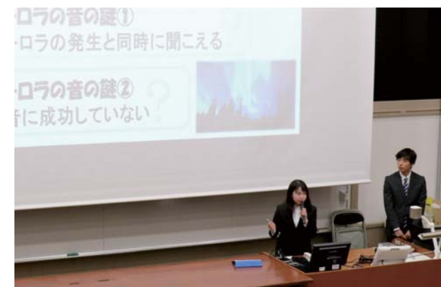
学生チャレンジコンテスト(SPEC)採択発表会 採択プロジェクトについてプレゼンする学生たち