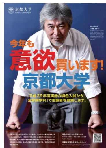
特色入試ポスター

○ はOriginal and Optimistic。これまでの常識を塗り替えるような発想は、実は多くの人の考えや体験を吸収した上に生まれます。そのためにはまず、自分が素晴らしいと感動した人の行為や言葉をよく理解し、仲間とそれを共有し話し合いながら、思考を深めていく過程が必要です。自分の考えに行き詰まったり、仲間から批判されて悲観しそうになったりしたとき、それを明るく乗り越えられるような精神力が必要です。失敗や批判に対してよくよせず、それを糧にして自分とは異なる考えを取り入れて成功に導くような能力を涵養しなければなりません。その機会を京都大学になるべくたくさん作るように環境を整えようと思っています。