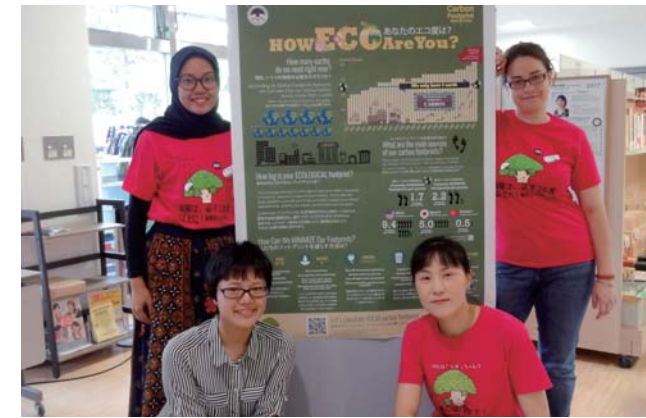
エコ〜るど京大初夏の陣