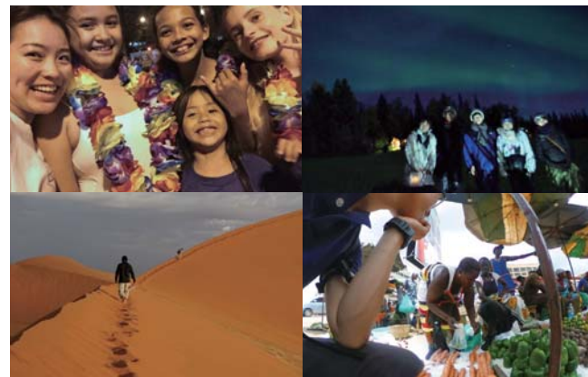
「おもろチャレンジ」派遣の様子

WはWild and Wise。すなわち野生的で賢い学生を育てようという目標です。現代の学生は内にこもりがちで、IT機器を常時持ち歩き、狭い仲間うちだけで絶えずつながりあう傾向にあると言われていいます。そのため、ひとりよがりの判断でよしとしてしまう風潮が広がりつつあります。理にかなう優れた選択や行動を実施するためには、情報を正しく読み、自分ばかりでなく他者の知識や経験を総動員して自己決定する意思を強く持つことが必要です。大学キャンパスの中はもちろんのこと、それ以外にもこうした対話と実践の場を多く設け、タフで賢い学生を育てようと考えています。