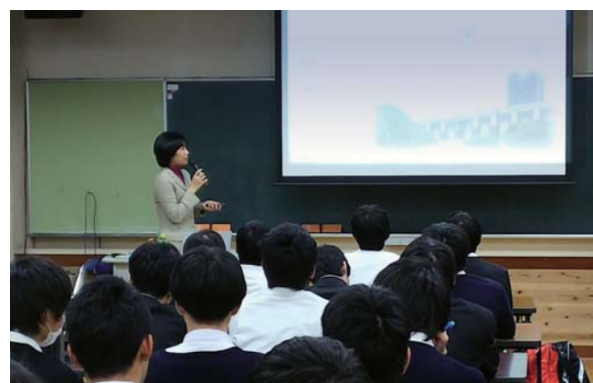
「学びコーディネーター事業」における出前授業の様子