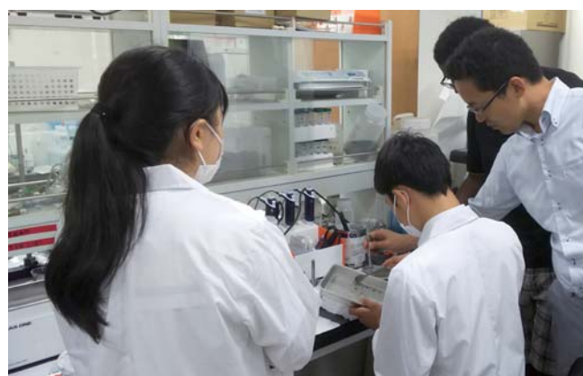
高校生を対象としたELCAS(エルキャス)指導風景