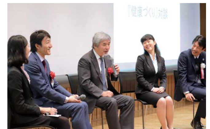
「京都大学ヘルシーキャンパス」キックオフフォーラム 「学生が考える健康づくり対談」の様子