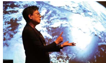
TEDxKyoto University 2017

「I」はInternational and Innovative。国際性豊かな環境の中で、常に世界の動きに目を配り、世界の人々と自由に対話しながら、時代を画するイノベーションを生み出そうとするものです。海外の大学や研究機関、産業界等を通じた多様な交流を通じて、これらの動きを作り出そうと考えています。