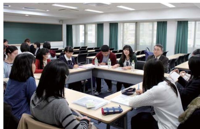
女子高生・車座フォーラム